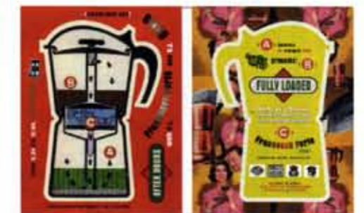
Roxy-flyer (voor- en achterkant) Koffiepot eruit gestanst Het stansgat vertelt je alles over de after-party

'Door de zapformule krijgt elk verhaal een eigen smoel'