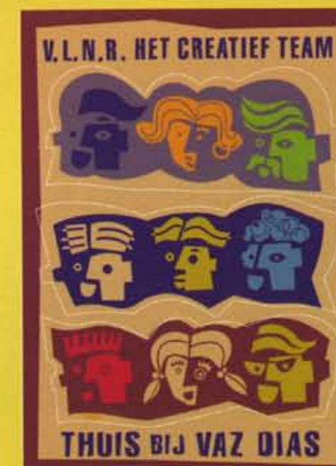
Illustratie voor reclamebureau Vaz Dias