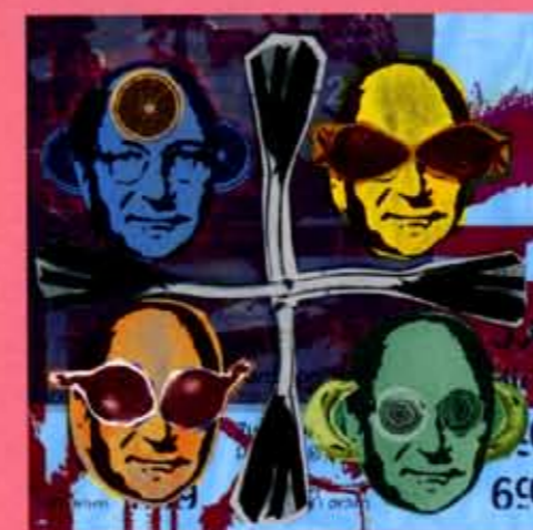
Portret-illustraties in opdracht van media partners voor AH boekje Eetcultuur